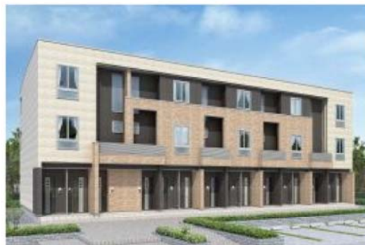
【ホワイト&amp;オレンジ】