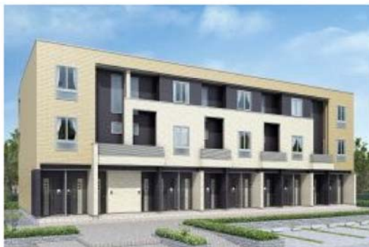
【イエロー&amp;ホワイト】

『モデッサⅢ』は、シングル及びカップル向けの集合住宅で、プライバシー確保に優れた3層フラットタイプ(※)を採用しています。2006年6月に発売した、同シリーズの木造2×4工法2階建賃貸アパート『 モデッサ24 』の契約は1,000棟を超え、大変好評をいただいております。この度、3階建て新商品を追加することにより、一層の販売促進を図って参ります。