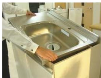
(取り外し可能なシンクトップ)

実際にキッチンの天板を取り外していただき、メンテナンスのし易さを体験していただけます。