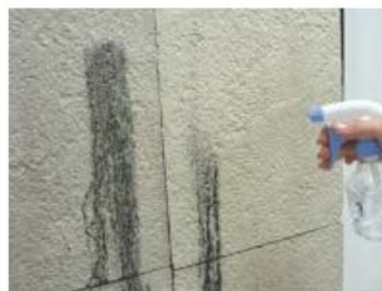
(セルフクリーニング効果の確認)

一般的な外壁材では、付着した汚れはそのまま残ってしまいます。当社の外壁材は、特殊塗装を施すことにより、雨水が汚れの下に入り込み、汚れが雨水と共に流れ落ちるセルフクリーニング効果があります。実際に一般的な外壁材と当社の外壁材に汚れを付着させ、そこに水をかけるだけで、どの程度汚れの落ち具合に違いが出るかを体験していただけます。