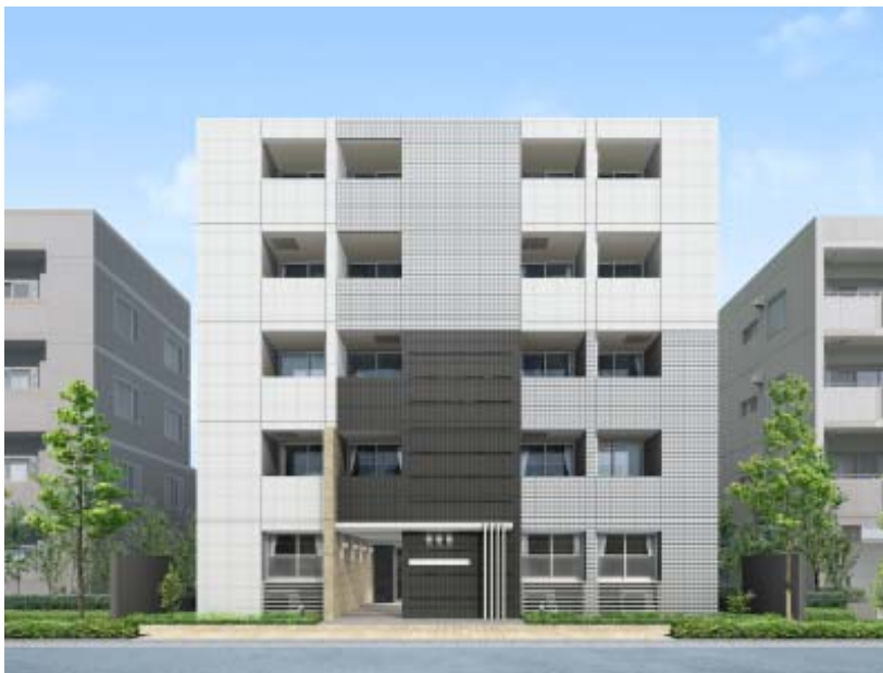
【シングルタイプ／5階建／モノトーン】