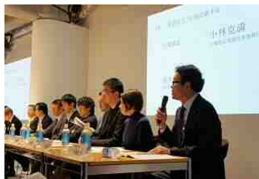
11月16日のプレスカンファレンスの様子