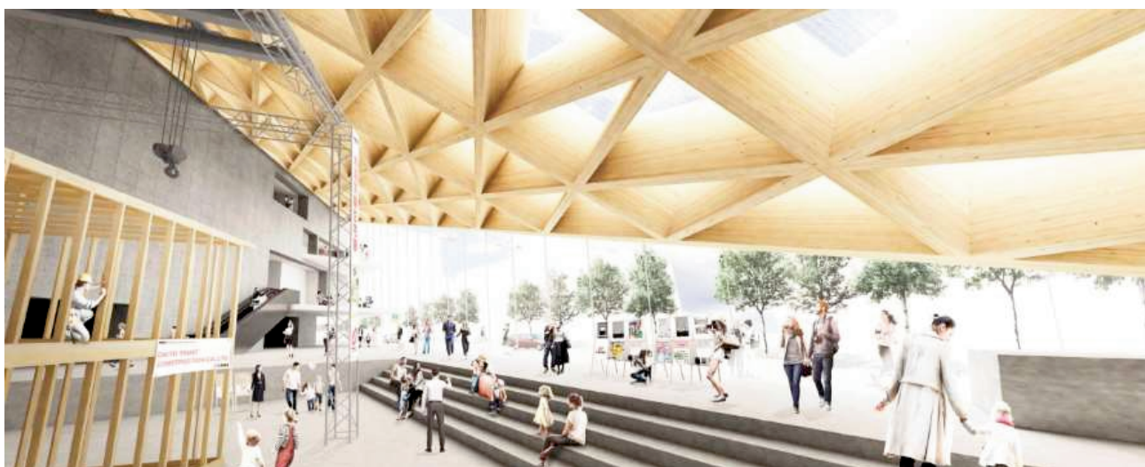
【エントランスイメージ】 CLTを使用したファサードが特徴的なエントランスは、情報発信機能を兼ね備えた吹き抜けの開放的な空間(アトリウム)