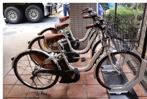
ステーションの設置イメージ