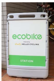
ステーションの目印

車の使用を低減することによるCO 2 排出量の削減や市街地の混雑緩和など、様々なメリットがあります。