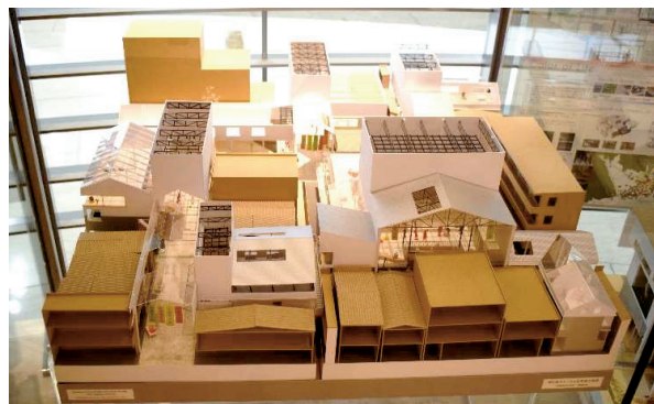
最優秀賞作品の模型