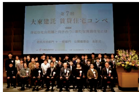
表彰式での集合写真

公式URL : http://www.japan-architect.co.jp/kentaku/