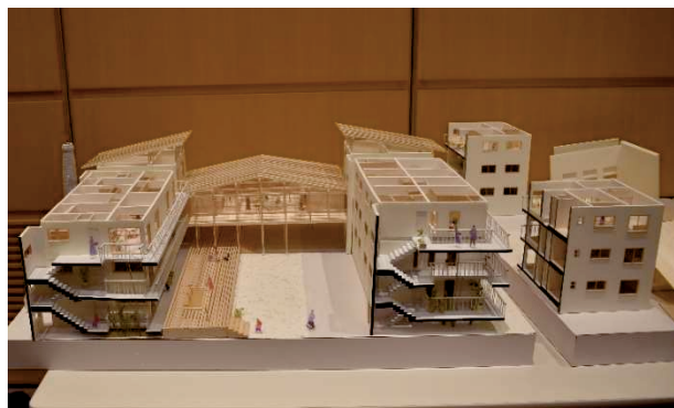
最優秀賞作品の模型