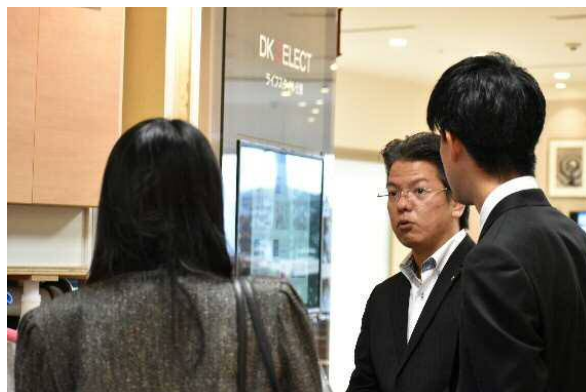
ショールームを見学しながら、内定者や保護者から質問を受ける先輩社員