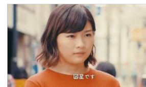
「わたしのいい部屋、いい暮らし。」