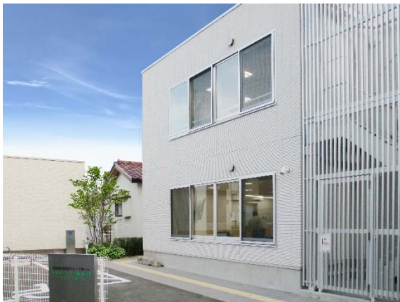
「ケアパートナー磯子中原・グループホーム」外観

※1 グループホームは地域密着型サービスの一つで、認知症の高齢者や障がい者などがスタッフから援助や介護を受けながら、少人数で共同生活を送る介護保険制度に基づく施設です。住み慣れた地域で生活を続けられるようにすることがグループホームの目的で、入居するには、原則として65歳以上で要支援2以上の認定を持ち、かつ医師より認知症の診断を受ける必要があります。