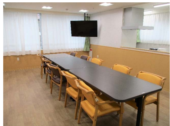
「ケアパートナー磯子中原・グループホーム」 食堂の様子