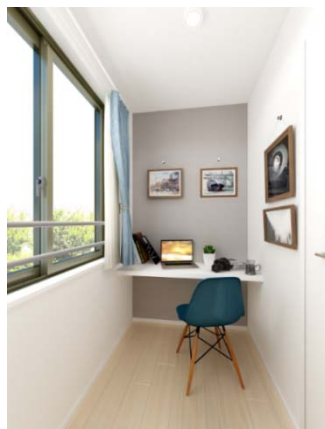
3階/ワーキングスペース