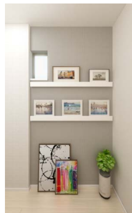
3階住戸・階段スペース/ フォトギャラリーウォール