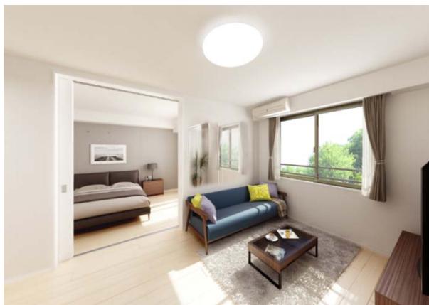
内観イメージ:2階 LDK/洋室1/サンルーム