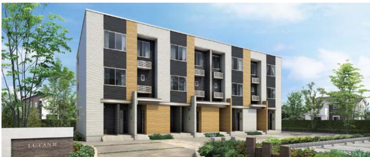
外観イメージ:4戸並び12戸タイプ(南側玄関プラン)

※ 2 共有の階段や廊下がなく、1階に面したそれぞれの独立した玄関から直接各戸へ入ることのできる集合住宅。