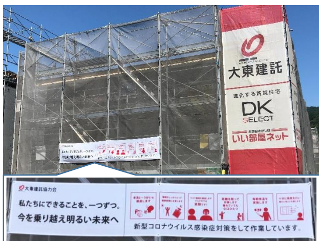
施工現場のメッシュシートに設置された横幕