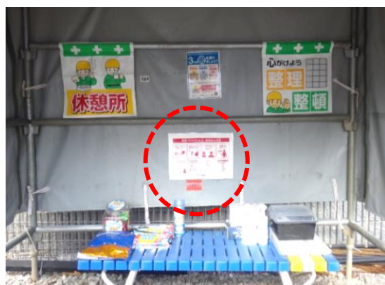
ピクトグラム看板が設置された休憩所

当社は今後も、現場従事者の安全確保を第一とした、新たな作業習慣の浸透と定着を目指していきます。