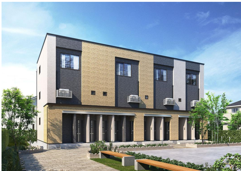
【外観イメージ】4戸並び(12戸)タイプ(北入り)

当社は2020年3月、当社人気No.1商品「LUTAN(ルタン)」シリーズとして、多雪地域のカップル・ファミリー世帯をターゲットとした3階建て賃貸住宅「LUTANⅢ多雪(ルタンスリーたせつ)」を発売しており、本商品は、単身世帯向けの間取りを追加することで、一人暮らし世帯の多い環境やニーズに対応しています。間取りは1階・2階が1K、3階が1LDKとなっており、入居者様それぞれのライフスタイルにあわせて使用できるリモートワークに適した「マルチコーナー」や、ゆとりのある居室間口で、快適なシングルライフをサポートします。外観は、アクセントが効いた門型の外壁デザインと、メタル調のモールを配置した、シンプルでスタイリッシュなデザインで、多雪地域の街並みに映える賃貸住宅をイメージしています。当社は今後も、地域のニーズに合わせた商品開発を通し、良質な賃貸住宅を提供していきます。