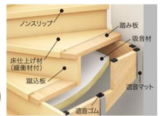
▲階段断面イメージ図