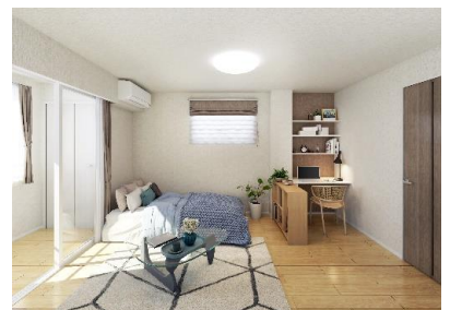
【内観イメージ】2階 洋室