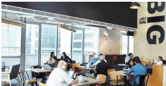
JustCoシンガポール店イメージ

シンガポールを拠点に、アジア・太平洋の地域の9か国・約40以上の場所でコワーキングスペースを提供しており、10万人以上の会員を誇ります。