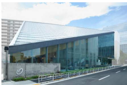
ROOFLAG賃貸住宅未来展示場 外観

所在地 : 東京都江東区東雲一丁目4番1号 アクセス : 東京メトロ有楽町線・東京臨海新交通臨海線(ゆりかもめ)「豊洲」駅 徒歩11分 : 東京臨海高速鉄道りんかい線「東雲」駅 徒歩14分 構造・規模 : RC・一部鉄骨・一部木造、地上4階 設計 : 株式会社マウントフジャーキテクトゥスタジオ一級建築士事務所 オープン日: 2020年6月8日 公式HP : https://www.kentak.co.jp/rooflag/