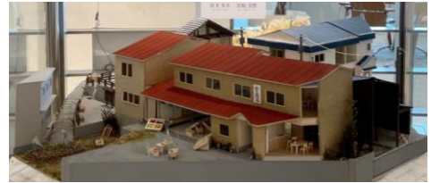
第9回賃貸住宅コンペ 2位入賞作品 「村ごと賃貸! -野沢温泉村における湯仲間再編と 新村人の賃貸住宅の設計-」

「賃貸住宅が持つ魅力」をより多くの方と考えていきたいという思いのもと、2012年より開催している当社主催の「賃貸住宅コンペ」。本展では、これまで開催した第4回から第9回までの受賞作品模型(約30点)の展示のほか、2022年4月より始まる第10回コンペの作品募集に向けた告知展示を行います。