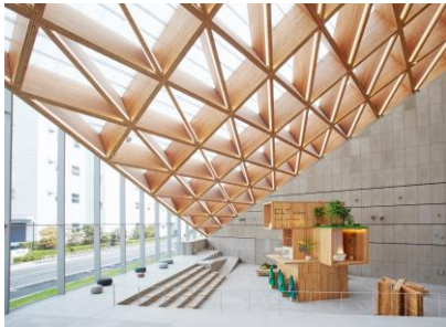
ROOFLAG賃貸住宅未来展示場 1階アトリウム

今回の建築展は、設計を志す学生や建築に興味のある一般の方にも、未来の住まいのあり方について考える機会としていただきたいと考え開催に至りました。