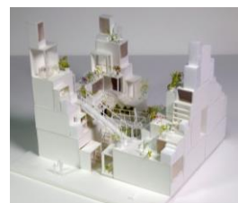
建築家・藤本壮介氏とのコラボ建築 「賃貸空間タワー」