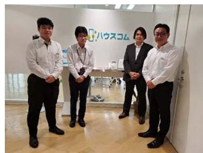
「障害者共働プロジェクト」メンバー

ハウスコムでは、大学の就職課が行う就職活動支援イベントに参加するなど積極的に障がい者採用を行っています。また、「障害者共働プロジェクト」を発足し、障がい者と健常者がともにいきいきと働ける職場づくりに取り組んでいます。プロジェクトに届いた障がい者社員の意見を反映し、本社内には、車いすでも自動販売機に手が届くよう、上段用の補助ボタンとテーブル・手すりが付いている「ユニバーサル自動販売機」を導入するなど、障がい者に配慮した職場環境構築をしています。