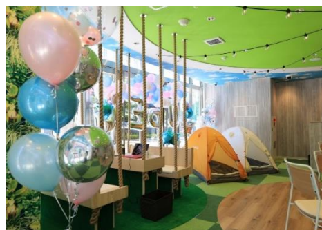
屋内でもアウトドア気分を楽しめる内装のオープン席(八千代店)

今後は、来年度中に愛知県名古屋市に2店舗、福岡県福岡市に1店舗のオープンを予定しています。