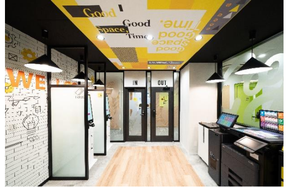
1階 いい部屋Space柏店内観