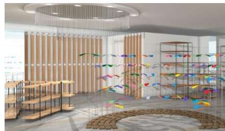
イベント会場イメージ