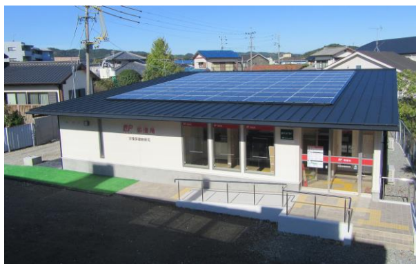
太陽光発電設備を備え、屋根にCLTを使用した 宗像東郷郵便局 外観(福岡県宗像市)