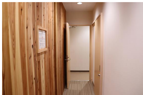
CLTパネルでできた壁