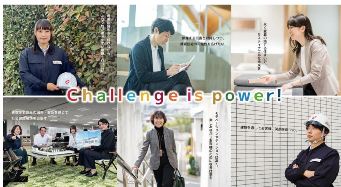
仮囲い掲出イメージ