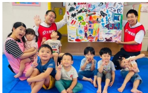
埼玉ヤクルト保育園わらびもぐもぐ保育ルームで実施したアート協働制作(2023年8月24日) https://www.kentaku.co.jp/kp/article/20231130_karigakoi.html

仮囲いを活用した取り組みは、地域の課題解決や地域活性化を目指して、当社グループが独自に行っている、地域と当社グループとの協働活動「地域コミュニケーション活動」にも展開されています。昨年からスタートした「仮囲いアート共同制作」では、建築現場の仮囲いに掲示する絵を、地域の子どもたちと共に制作しています。「未来の街」や「住みたい家」などをテーマとした絵を自由に描いてもらうことで、子どもたちに街や家について考える機会を提供しています。