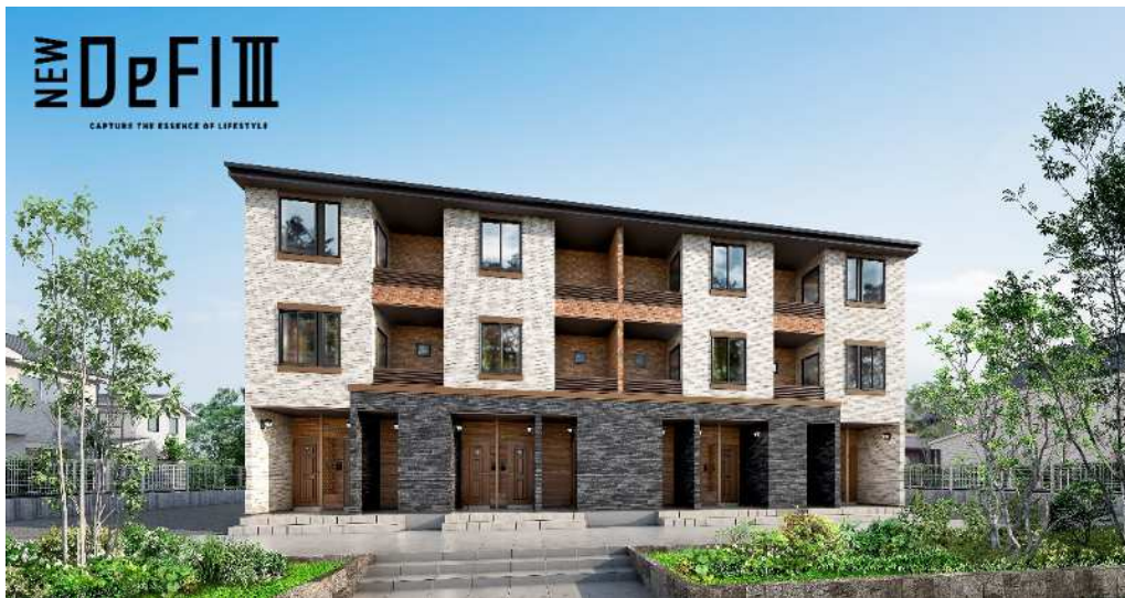
外観イメージ(プラン:北側玄関の4戸並び、外壁:ストーンナチュラル)